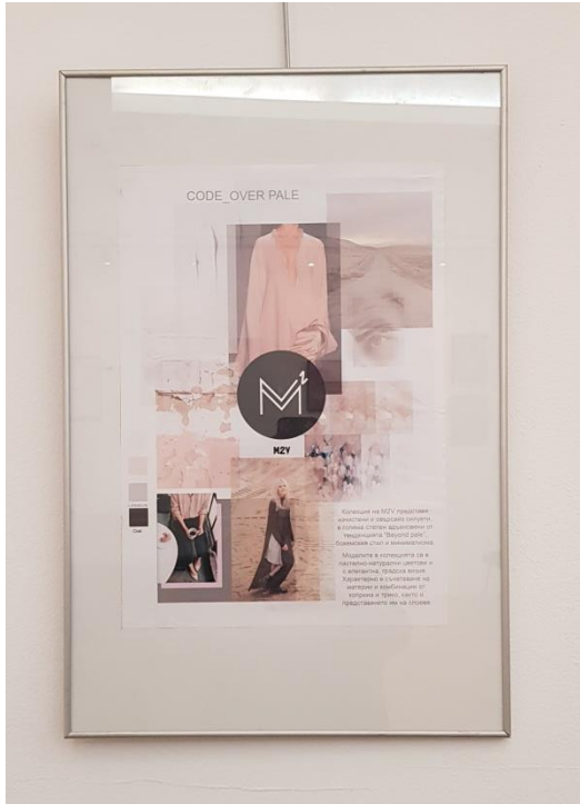
Ас. Мария Миличин - moodboard