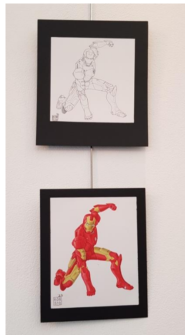
Константин Касабов – персонаж