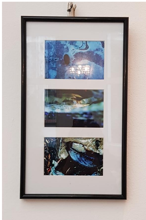
доц. д-р Ралица Стефанова – фотография