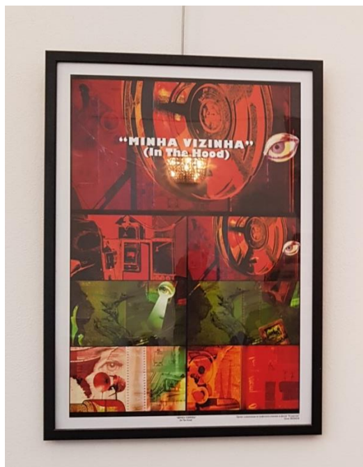
ас. д-р Петко Якимов – плакат