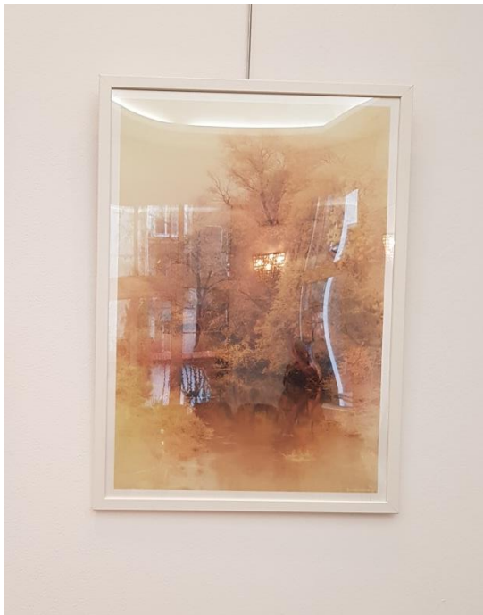
доц. д-р Иво Попов – фотография „Есен“