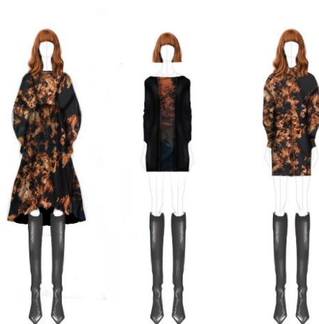
Модел на Анита Рачева