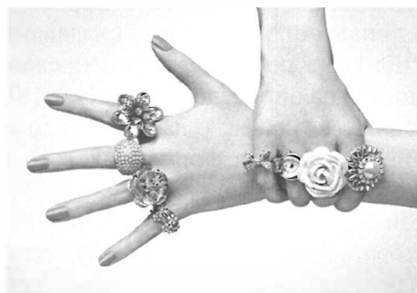
Фигура 2 Използване на различни материали

Достатъчен е бегъл поглед върху това, което може да се определи като "бърза" мода в бижутерията, за да се установят основните характеристики: за разлика от "бързата" мода при дрехите, както и при другите аксесоари, при бижутерията възможните варианти на използване са значително повече (напълно естествено с оглед на това, че в повечето случаи става дума за авторска изработка); широко използване на различни материали ( Фигура 2 ); полифункционалност при използването им.