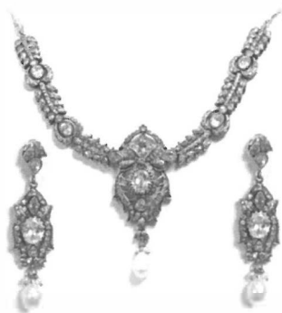
Фигура 6 Комплект бижута класически стил

Дизайнерските решения при "бавната" мода са достатъчно добре известни ( Фигура 6 ), при това навлизането на нови елементи е изключително бавно, като това особено важи за бижутата.