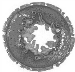
Фигура 3 Арт-дизайн

В повечето случаи може да бъде причислен към категорията на "бързата" мода достатъчно условно, като се има предвид устойчивия му