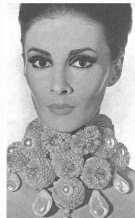
Фигура 1 Колие от 1965 г.

Като основна характеристика на "бързата" мода при бижутата е широкият, нетрадиционен диапазон на използваните материали, форми, модели и начини на използване. "Бързата" мода е много динамична, затова при създаването на бижута понякога се подчертава небрежността, преходността на определени артикули ( Фигура 1 ). Основният стремеж е да се намери такова съчетание на материал, форма и място на бижутото, което да концентрира вниманието върху него. Този стремеж може да се наблюдава както при цветовата гама, "съчетанието на несъчетаемото", в редица случаи целенасочено "грубата" форма на определен елемент, който при по-близко "запознанство" с него поразява със своята прецизност при изработката и използването на най-модерни технологии.