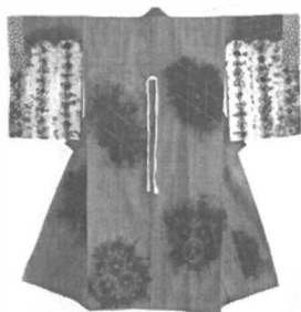
Фигура 1 Кимоно обагрено със смесени техники "сибори"

Тази статия ще разгледа случаите, при които древната японска техника "Сибори" 2 е вдъхновила различни дизайнери при създаването на шалове, чанти и накити от текстил. Понятието "Сибори" е неправилно преведено на английски и често се среща като "шибори". Сибори е древна японска техника за орнаментиране на текстилни материи чрез багрене и резервиране ( Фигура 1 ). Съществува безкраен брой способности на връзване, сгъване, пришиване, усукване и притискане и всеки дава неповторим резултат. За получаване на определен ефект от голямо значение е използвания плат. Най-ранният известен пример за багрене на плат с тази техника е от 8 век. Тогава са използвали растителна боя индиго най-често върху коприна, а по-късно и върху памук.